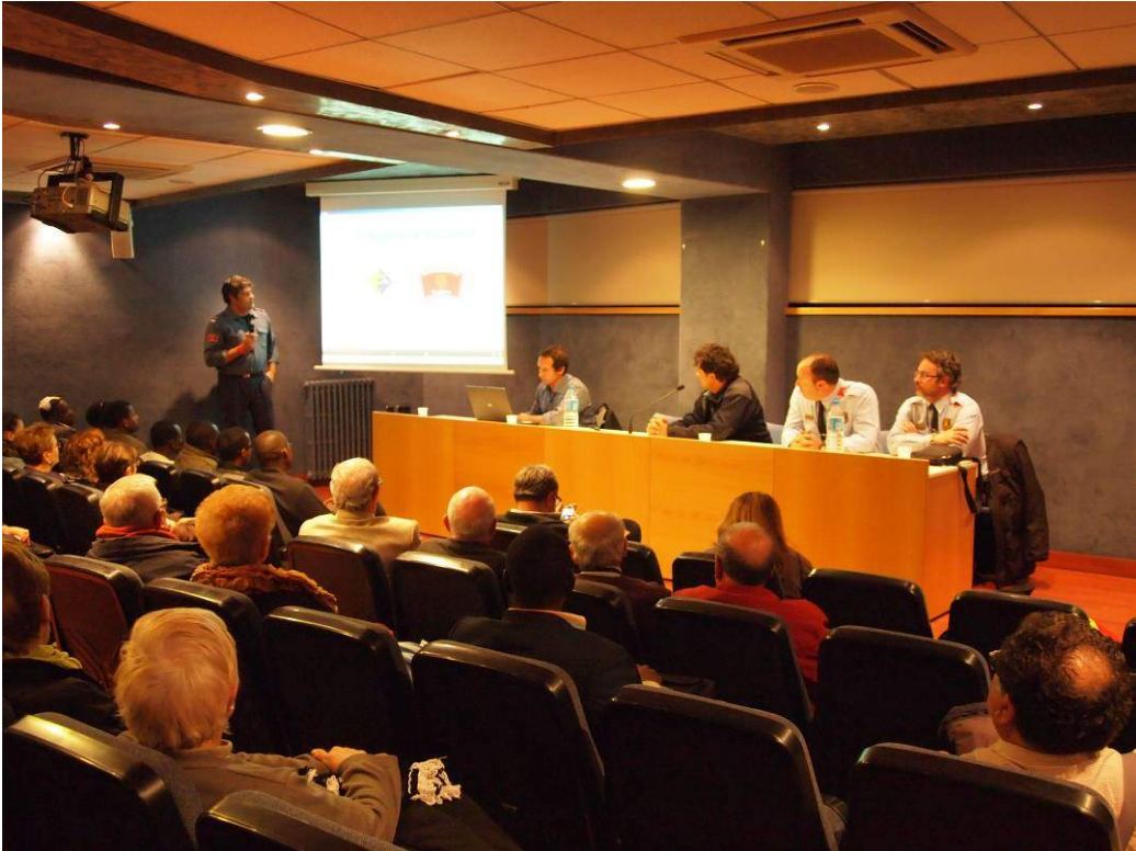
Charla en el barrio de Cerdanyola con los voluntarios embajadores y los vecinos: 26/3/2014